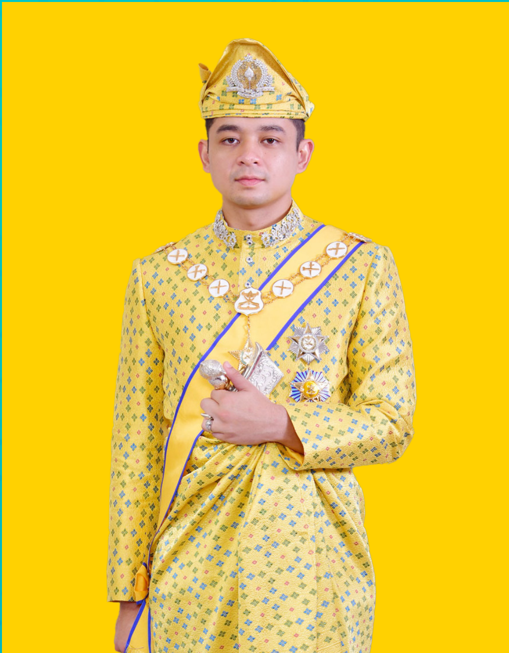
KEBAWAH DULI PADUKA MULIA TENGKU MAHKOTA PAHANG TENGKU HASSANAL IBRAHIM ALAM SHAH IBNI AL-SULTAN ABDULLAH RI'AYATUDDIN AL-MUSTAFA BILLAH SHAH DK., SAAS., SSAP., SIMP.

PRO-CANSELOR UNIVERSITI MALAYSIA PAHANG AL-SULTAN ABDULLAH